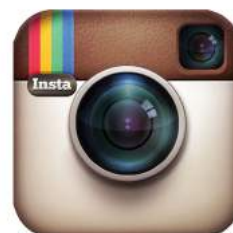
Figura 1.2 logo instagram