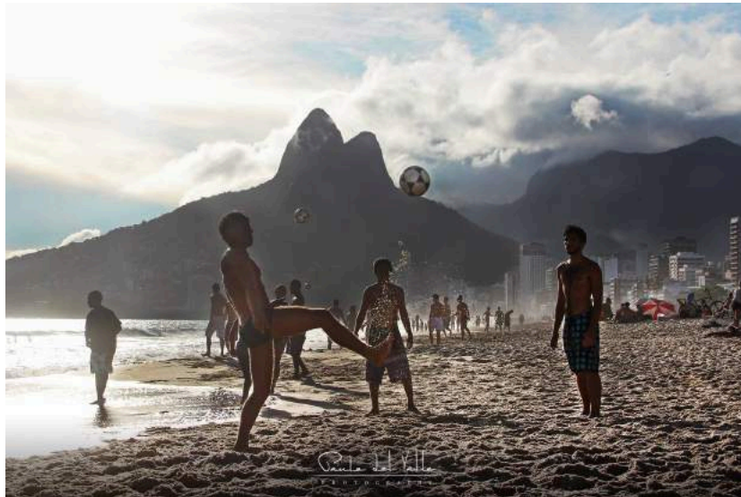
Figura 4.2: Rio de Janeiro - 2014