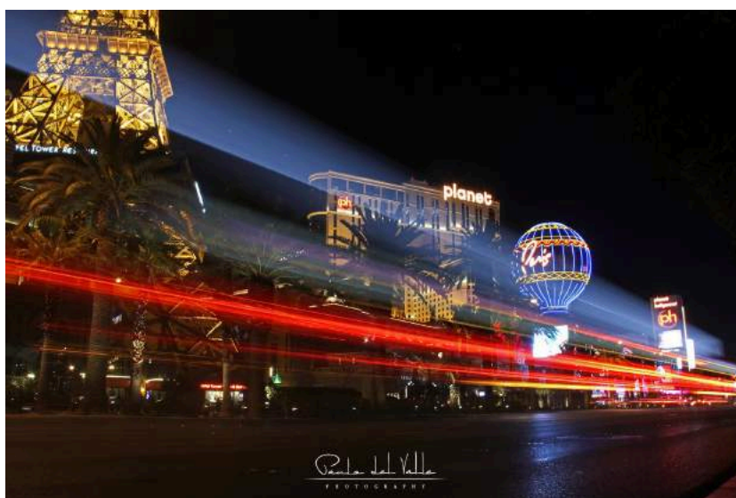
Figura 4.1: Las Vegas - 2014

Além de viagens incríveis, em prol da divulgação de lugares como Dubai, Del Valle também recebeu um convite para conhecer a sede do Instagram na Califórnia. Em seu perfil podemos ver fotos de todos os seus trabalhos, inclusive de sua ida a empresa.