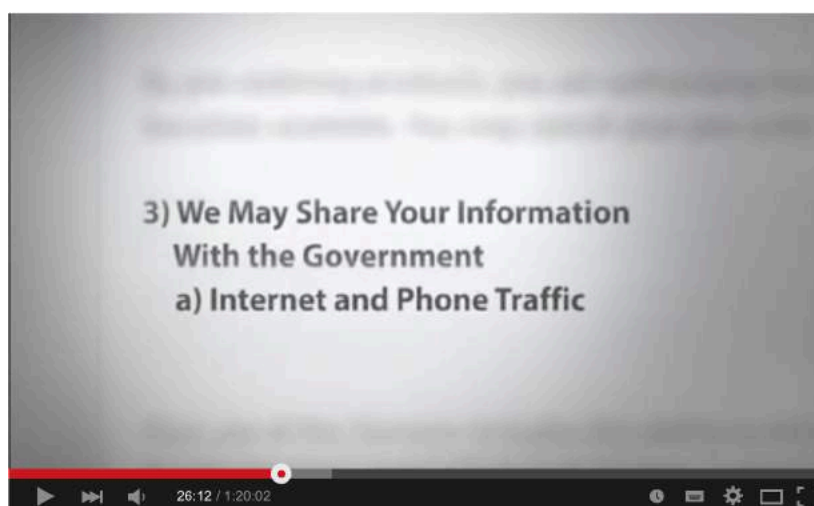
Figura 2.1: Trecho do documentário " Terms and Conditions you may apply "

No documentário " Terms and conditions may apply ", de Cullen Hoback (EUA, 2013), vemos que esse processo em que as informações pessoais vindas da internet podem ser divulgadas começou a ser legalizado pelo governo americano após o atentado terrorista em 11 de setembro de 2001.