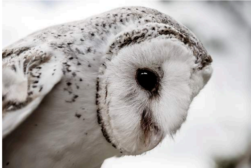
Figura 3.2: Gold Coats , Austrália – 2015