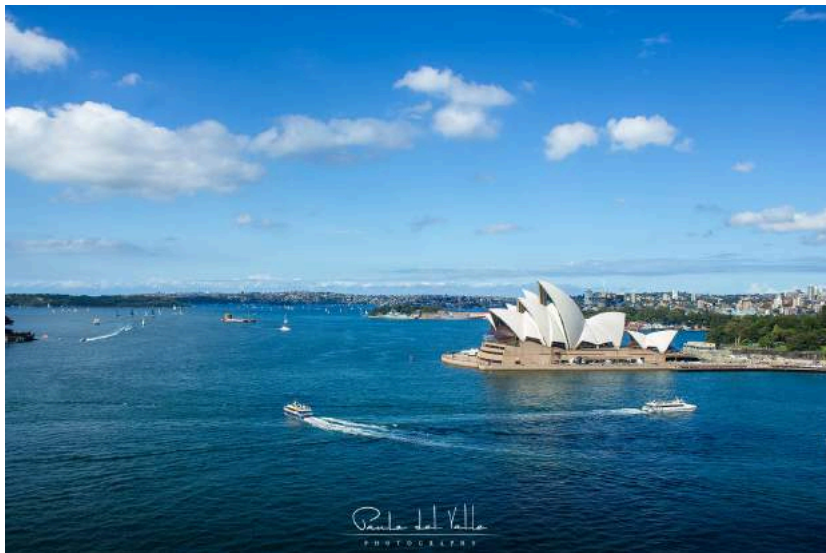
Figura 4.3: Sidney – 2014