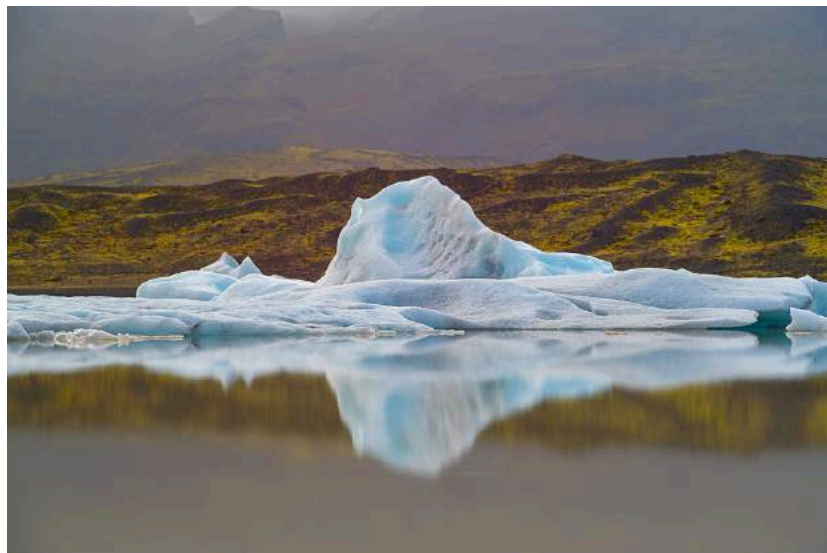
Figura 3.3: Iceland – 2015