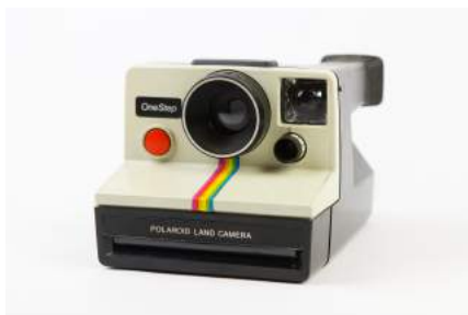
Figura 1.1 câmera polaroid

A própria logo do aplicativo já caracteriza bem sua função. Este é baseada na imagem de uma Câmera Polaroid , que é um tipo de máquina fotográfica que revela instantaneamente a imagem.