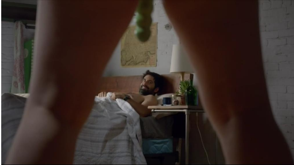
Figura 5: Abbi sai do banheiro usando a cinta peniana, diz a Jeremy para se virar e ele sorri.

É interessante a quebra de expectativa que Abbi tem em relação a Jeremy. De repente, aquele homem com quem sempre sonhou propõe uma prática sexual muito diferente do que poderia imaginar. Após o encorajamento de Ilana, Abbi rompe com seus conceitos e inseguranças e sai do banheiro com toda a confiança do mundo, já vestida com a cinta. Broad City apresenta uma prática sexual muito rara de ser abordada na ficção e até mesmo na vida real: o pegging 18 . A série ainda o faz sem julgamentos e sem a conotação homofóbica comumente associada à prática, além de inverter o padrão heteronormativo com naturalidade. Os dois curtem um ao outro e a noite termina com Abbi se sentindo muito feliz por ter tido uma nova experiência com o homem que sempre desejou.