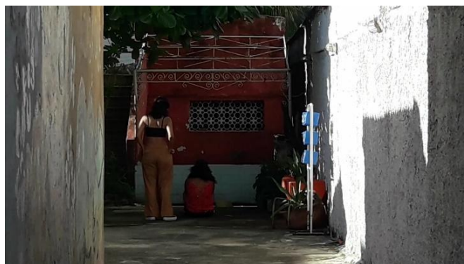
Figura 6 – Frame do minuto lumiere de Rachel e Igor