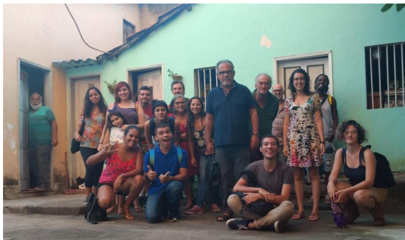
Figura 3 – Foto da turma