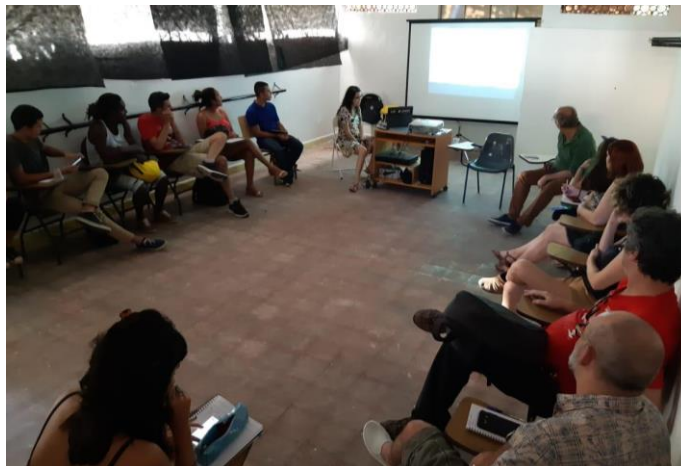
Figura 2 – Registro do primeiro encontro