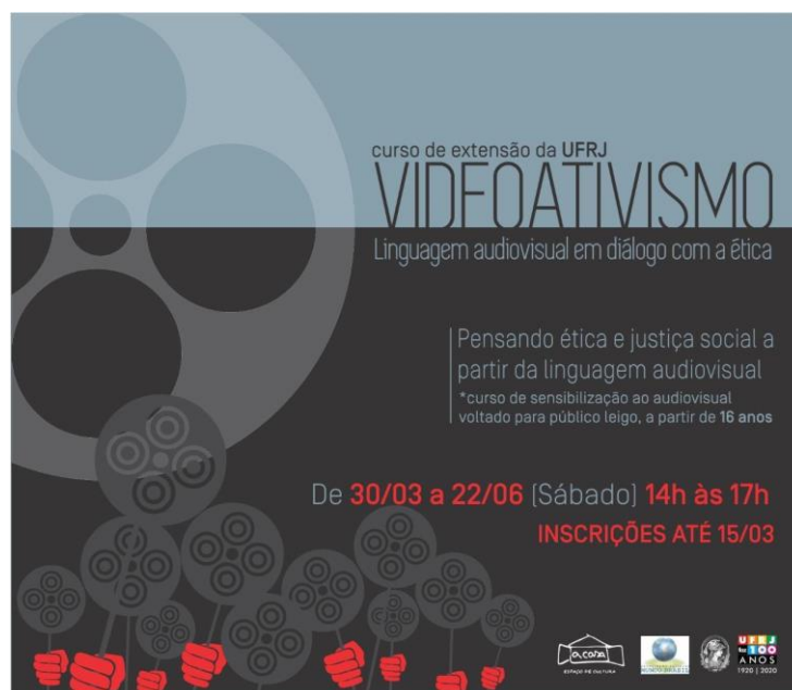
Figura 1 - Flyer virtual de divulgação do curso