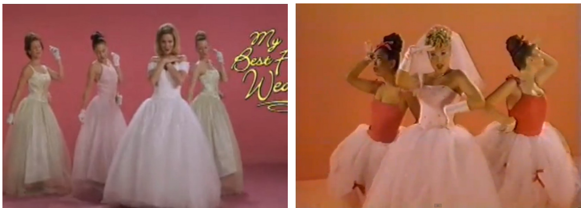
A título de comparação, um quadro da sequência inicial do filme americano (à esquerda) e outra do filme brasileiro (à direita).

Outra característica marcante é a paródia, neste caso do próprio universo televisivo 26 : cada vez que o controle remoto muda de canal conforme a trama se desenvolve, os personagens percorrem os mais variados gêneros cinematográficos e televisivos presentes nos canais da programação. Além disso, o filme começa com um número musical no qual Angélica e dançarinas vestidas com roupas de noiva cantam em frente a um fundo rosa, fazendo referência direta à sequência inicial de O Casamento do Meu Melhor Amigo ( My Best Friend's Wedding , P. J. Hogan), comédia romântica de sucesso em 1997.